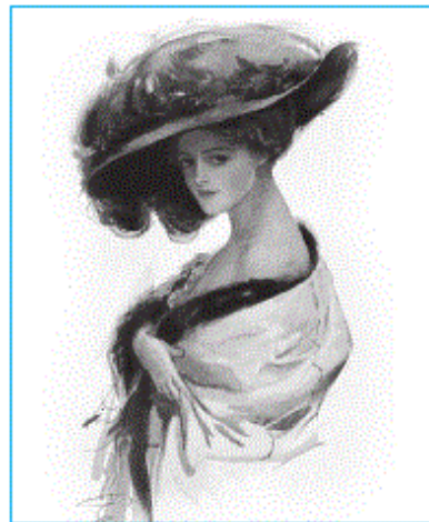
Тип героини зрелой лирики А.Григорьева

героя, которого, говоря словами А.С.Пушкина, «настигло страшное безумие любви».