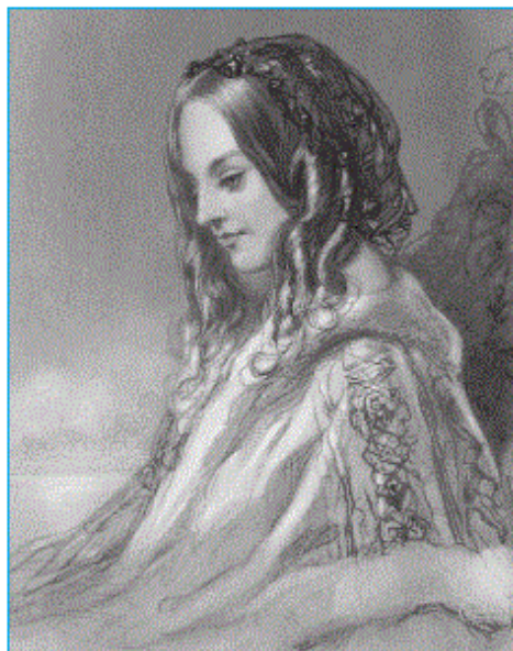
Тип героини ранней лирики А.Григорьева

например, Некрасов создает произведения о декабристках, о женщинах «русских селений», т.е. крестьянках, создает образы и тех, кого горькая нужда гонит на панель, то у Григорьева женский образ дается в аспекте отвлеченно-психологическом: